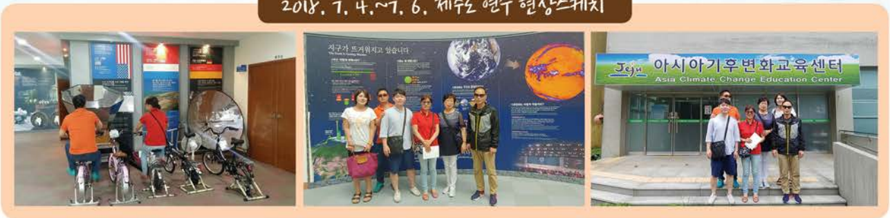
2018. 7. 4.~7. 6. 제주도 연수 현장스케치

관악구시설관리공단 직원들이 7월 4일부터 7월 6일까지 제주도로 국내연수를 다녀왔습니다. 아시아기후변화교육센터에서는 온실가스 줄이기, 녹색생활실천 등 친환경경영 정보를, 제주도 3R+ 환경센터를 방문하여 자원절약 및 재활용 관련 녹색경영 지식을 얻었습니다. 연수를 통해 더 넓은 세상을 경험하고 그 지식을 업무에 적용한다면 공단발전에도 많은 도움이 되겠죠? 관악구시설관리공단은 직원연수를 통해 많은 것을 배우고, 선진공단을 향해 더욱 정진하겠습니다.